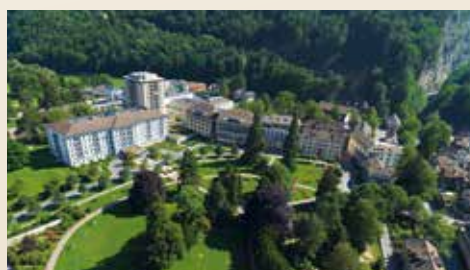
Grand Resort Bad Ragaz