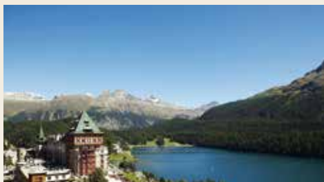
Badrutt's Palace St.Moritz