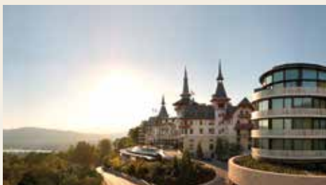
The Dolder Grand Zürich