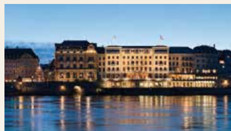
Les Trois Rois Basel