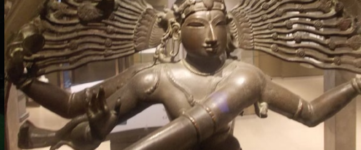
Shiva schlägt mit der Handtrommel den Rhythmus der Schöpfung, Südindische Bronze, 12. Jahrhundert, privat