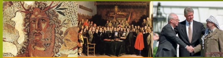
Bildnachweis: Ein Christlichs lied Doctoris Martini Luthers, in: Etlich Cristlich liden, Nürnberg 1524, Staatsbibliothek zu Berlin – PK, Abteilung Historische Drucke, Signatur: Litbr impr. ran. qu. 189.aa.1, Vinca Musi/The White House, wikipedia

Ringvorlesung mit Vorträgen und Konzerten