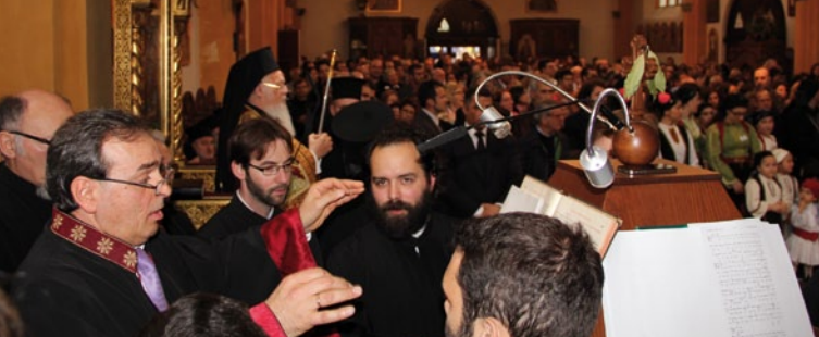
Mitglieder des byzantinischen Kantorenchors München, privat