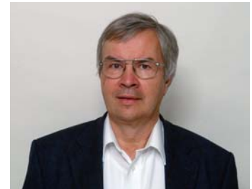
Nobelpreisträger Theodor W. Hänsch