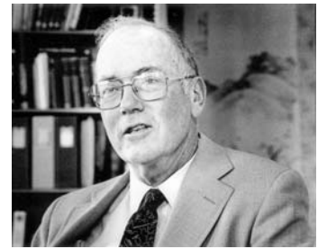
Nobelpreisträger Charles H. Townes

Internationaler wissenschaftlicher Kongress