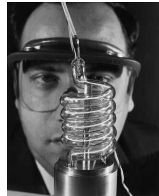
Theodor Maiman mit dem ersten Rubinlaser.

Diese Presseinformation ist im Internet abrufbar unter: www.kit.edu