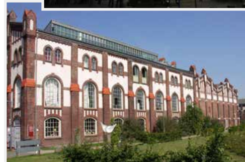
Im Rahmenprogramm: Zeche Zollverein, Museum Folkwang, Rewirpower-Stadion, Zechengelände Waltrop (von oben).