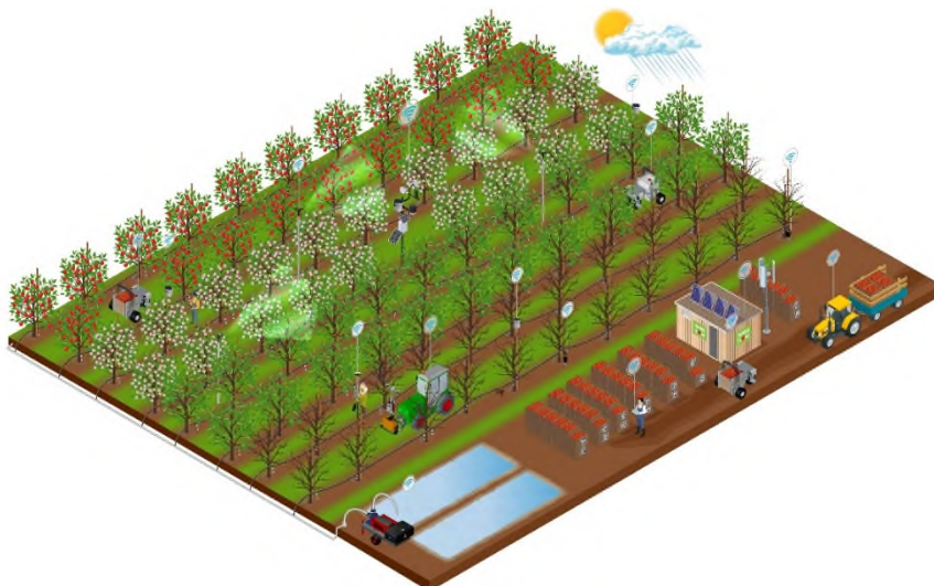
Abbildung 1 | Bildunterschrift

© Fraunhofer IFAM, © TU Hamburg; Veröffentlichung frei in Verbindung mit Berichterstattung über diese Presseinformation. https://www.ifam.fraunhofer.de/de/Presse/Downloads.html