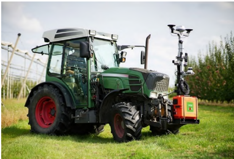
Abbildung 2 | Bildunterschrift

Über die Dreipunktaufnahme an jedem Schlepper montierbar: die im Rahmen des Projekts »SAMSON« vom Fraunhofer IFAM in Stade entwickelte »Sensorbox« zur Datenaufnahme und -verarbeitung in Obstbauanlagen. Dieses Multi-Sensorsystem enthält die Sensorik zur Erfassung von Kamerabildern und präzisen GPS-Signalen.