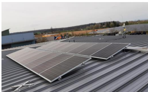
Abb. 2: PV Module der 5 kW Demonstrationsanlage auf dem Dach der ÜZ Mainfranken Lülsfeld.

Bei Veröffentlichung bitten wir um die Zusendung eines Belegexemplars!