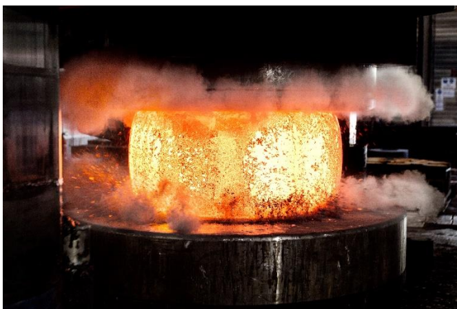
Abb. 1 Umformprozesse erfordern häufig einen hohen Energieeinsatz. Simulationsbasierte Optimierungen der Prozessketten leisten einen wichtigen Beitrag zur CO 2 -Reduktion.