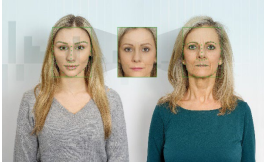
Abb. 2 Das Fraunhofer IGD arbeitet an Methoden zur Erkennung und Verhinderung von Facemorphing-Angriffen – dem Verschmelzen zweier Gesichter zur Täuschung biometrischer Systeme.

Die Fraunhofer-Gesellschaft mit Sitz in Deutschland ist eine der führenden Organisationen für anwendungsorientierte Forschung. Im Innovationsprozess spielt sie eine zentrale Rolle – mit Forschungsschwerpunkten in zukunftsrelevanten Schlüsseltechnologien und dem Transfer von Forschungsergebnissen in die Industrie zur Stärkung unseres Wirtschaftsstandorts und zum Wohle unserer Gesellschaft. Die 1949 gegründete Organisation betreibt in Deutschland derzeit 74 Institute und Forschungseinrichtungen. Die rund 30 000 Mitarbeitenden, überwiegend mit natur- oder ingenieurwissenschaftlicher Ausbildung, erarbeiten das jährliche Finanzvolumen von 3,6 Mrd. €. Davon fallen 3,2 Mrd. € auf den Bereich Vertragsforschung.