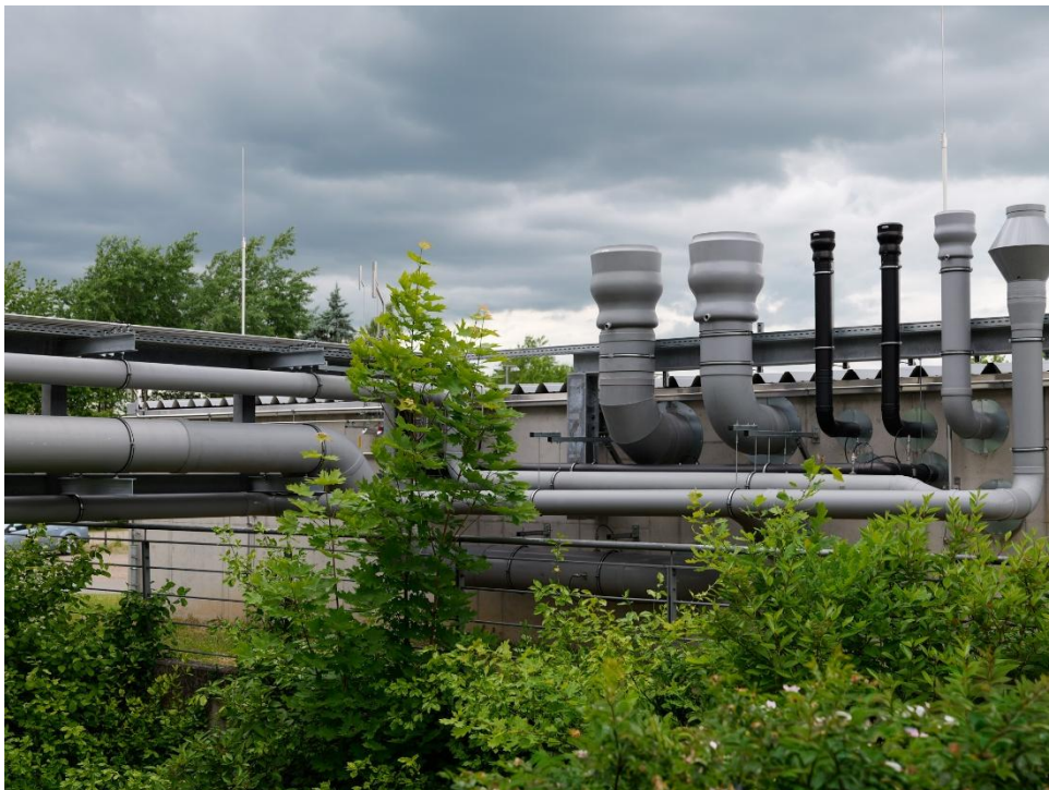
Abb. 3 Wasserstoffbrücke und Peripherie