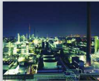
Rhein-Main-Cluster Chemie & Pharma