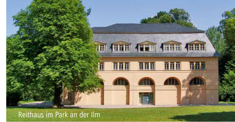
Reithaus im Park an der Ilm