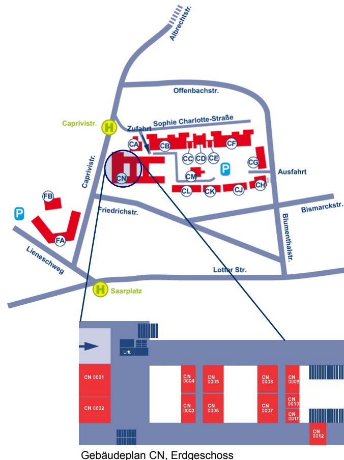
Gebäudeplan CN, Erdgeschoss

...mit Bahn und Bus: vom Hauptbahnhof Osnabrück: Stadtbus Linie 21 (Aus- stieg „Caprivistraße“), 31(R31)/32/33 (Ausstieg „Saar- platz“), Fußweg zum Tagungsort ca. 2 bzw. 8 Minuten.