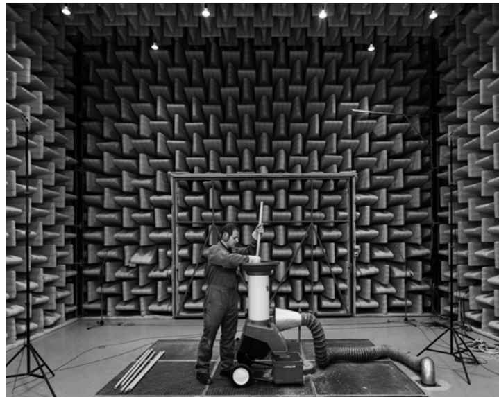
PUNKT 2012