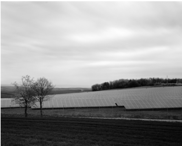
PUNKT 2011 (Fotostipendium) Thomas Imkamp