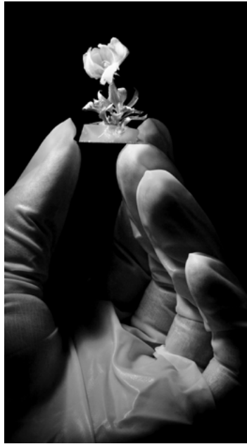
PUNKT 2009

Wer neue Entwicklungen originell und verständlich darstellt, schafft eine wichtige Voraussetzung dafür, dass Themen mit Technikbezug sachlich und unvoreingenommen diskutiert werden.