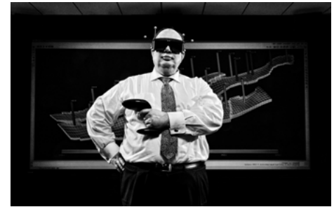
PUNKT 2011