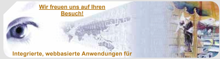
Integrierte, webbasierte Anwendungen für