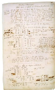
2 Tagebuch VIIa/b, 55r: Observations astronomiques, nach der Abfahrt von Turbaco, 19.4.1801