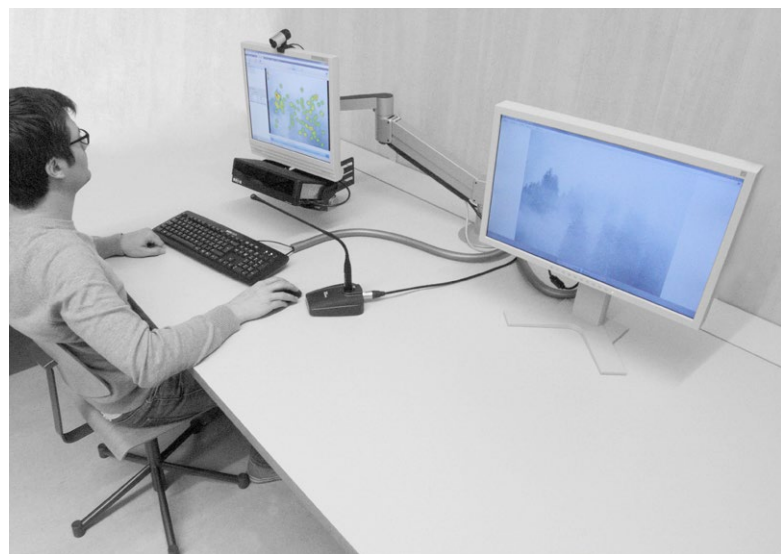
Test im Usability Labor

Der Major Web- und Usability-Engineering fokussiert auf die Benutzerschnittstellen von digitalen Informationsprodukten und Online-Anwendungen bzw. -Services. Neben dem notwendigen methodischen Wissen wird auch die praktische Kompetenz vermittelt. Das Usability-Team des Fachbereichs Informationswissenschaft betreibt das «SCHweizer Kompetenzzentrum für die EVALuation von wissenschaftlichen Informationsangeboten» CHEval ( www.cheval-lab.ch ) und greift auf eine jahrelange Erfahrung bei der Evaluation von Online-Angeboten zurück. Das zugehörige umfassend ausgestattete Usability-Labor bietet ideale Bedingungen für die Ausbildung in Usability Engineering und die Durchführung von Evaluationen.