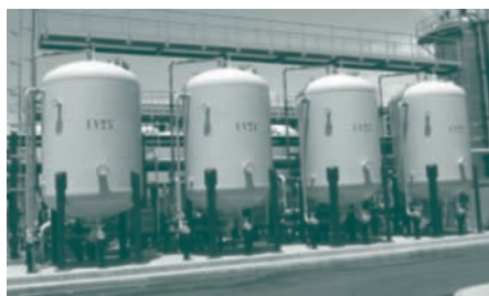
GEH Wasserchemie; Wasseraufbereitungsanlage, Olympischer Park, Beijing, China

Ziel des Projektes ist es, Wasseraufbereitungstechnologien zur Arsen- und Antimonfixierung durch mikrobiologisch aktive Eisenminerale zu optimieren. Ähnliche, bereits bekannte Verfahren sind bisher durch große Leistungsunterschiede bei gleicher Schadstoffbelastung nur eingeschränkt nutzbar. Im Rahmen von MicroActiv konnte erstmalig gezeigt werden, dass die Unterschiede in der Filterwirkung durch minimale Veränderungen der anorganischen und organischen Inhaltsstoffe hervorgerufen werden. Diese elementaren Erkenntnisse sind nun in ein neues Reaktionsmodell eingeflossen, aus dem praktikable Lösungsvorschläge zur Optimierung von Eisensulfidfiltern in Zusammenarbeit mit der Firma GEH Wasserchemie erarbeitet worden sind. Eingesetzt werden sollen diese ökonomisch und ökologisch effizienten Filter deshalb insbesondere zur Wasseraufbereitung in Entwicklungsländern.