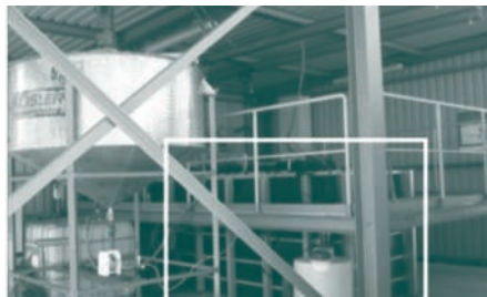
G.E.O.S. Freiberg Ingenieurgesellschaft mbH; Pilotanlage in Nochten

Ziel des Vorhabens ist es, Schwertmannit (Eisenhydroxysulfat), der als Reststoff bei der Aufbereitung von Abwässern des Braunkohlebergbaus anfällt, als eine kostengünstige Wasserbehandlungsmethode zur Beseitigung von Arsen zu nutzen. In einer Pilotanlage der G.E.O.S. Freiberg mit Unterstützung der Vattenfall Europe Mining AG soll die Synthese von Schwertmannit biotechnologisch optimiert werden, um im Dauerbetrieb hohe Raum-Zeit-Umsatzraten zu erreichen. Hierzu wurde durch die Trennung zweier chemischer Prozesse (Eisenoxidation und Schwertmannit-Fällung) bei einer Erhöhung des pH-Wertes die Optimierung der Schwertmannit-Fällung bereits erfolgreich getestet. Ebenfalls wurden erfolgreich Versuche durchgeführt, Arsen und weitere Schadstoffe an das Eisenhydroxysulfat zu binden und somit beispielsweise Grubenwasser zu reinigen. Die Methode kann ebenfalls in Entwicklungsländern bei der Wasseraufbereitung von toxischen Grubenwässern eingesetzt werden.