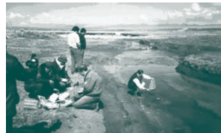
Ableitung saurer Grubenwässer aus Colquijirca, Peru, Quelle: BGR

Weltweit führt Bergbau aufgrund der Verlagerung großer Gesteinsmengen zu einer verstärkten Verwitterung von Sulfiden. Hierdurch können saure, sulfathaltige Oberflächenwässer mit einem erhöhten Anteil von Schwermetallen entstehen. Wie genau diese mobilisiert werden und welche Rolle Mikroorganismen bei der Auflösung und Verwitterung von Monosulfiden spielen, wird im Rahmen des Projektes untersucht. Dabei wird der Ansatz verfolgt, aus der Bestimmung von Strukturen, Phasen und Reaktionen im Nanometerbereich ein Prozessverständnis auf größeren räumlichen und zeitlichen Skalen zu erlangen. Von besonderem Interesse sind dabei neu gebildete Mineralphasen, mit sehr geringer Korngröße (Kolloide), die einerseits hochmobil sind, aber andererseits auch toxische Substanzen binden können. Diese Untersuchungen sollen eine wissenschaftliche Grundlage zur Entwicklung und Bewertung geeigneter Sanierungsstrategien liefern.