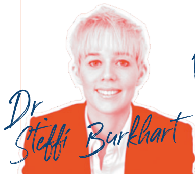
Schirmherrin Tag 2, Expertin der Generation Y, Autorin, Impulsgeberin