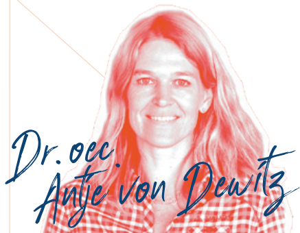
Geschäftsführerin des Outdoor-Ausrüsters VAUDE in Tett nang