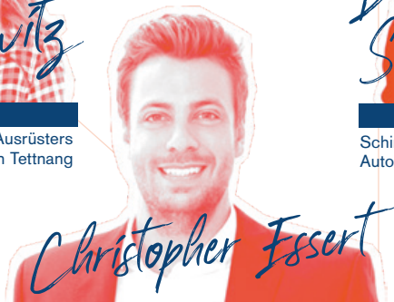
Gründer/Geschäftsführer, Essert GmbH