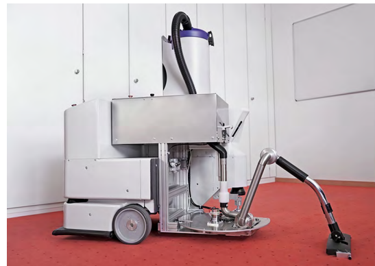
Der Reinigungsroboter mit dem Modul zum Staubsaugen bei der Erprobung in den Büroräumen der Dussmann-Hauptverwaltung in Berlin.