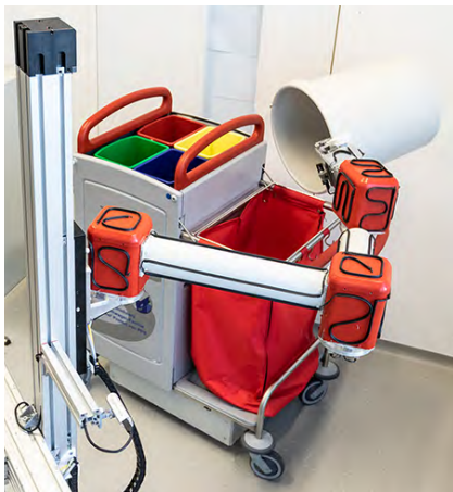
Der Roboterarm kann Papierkörbe selbstständig erkennen, greifen und den Inhalt in einen Sammelbehälter entleeren.