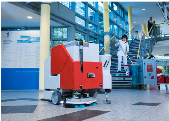
Der Reinigungsroboter mit Nassreinigungsmodulem beim Praxistest in einem Krankenhaus.