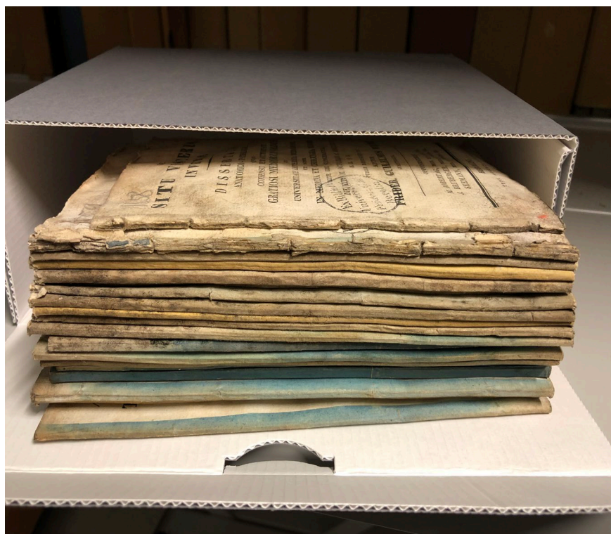
Eine zertifizierte Archivverpackung ist eine einfache wie effektive Maßnahme zur Bestandserhaltung.

Die einmalige Hochschulschriftensammlung der Humboldt-Universität wird gesichert