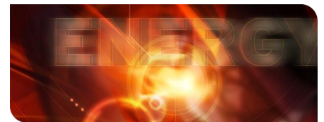
KIT-Zentrum Energie: Zukunft im Blick

Neueste energiewirtschaftliche Erkenntnisse gelangen dank greenventory direkt in Unternehmen, Städte und Quartiere. Ziel der Ausgründung mit Sitz in Freiburg ist „Data-driven decision support in energy“. Mit Daten und Softwaretools leistet greenventory eine zeitlich und räumlich hochaufgelöste automatisierte Inventarisierung, Analyse und Optimierung von kundenspezifischen Energiesystemen.