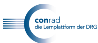
Logo conrad, die interaktive Lernplattform der DRG