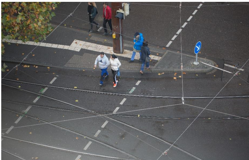
Die Reproduktionszahl R gibt an, wie viele Personen ein mit Corona Infizierter im Schnitt ansteckt. Forscher des KIT wollen die Zahl nun genauer schätzen.

Forscher des KIT entwickeln neue Methode mit akausalem Sieben-Tage-Filter zur Bestimmung des R-Werts bei Infektionskrankheiten