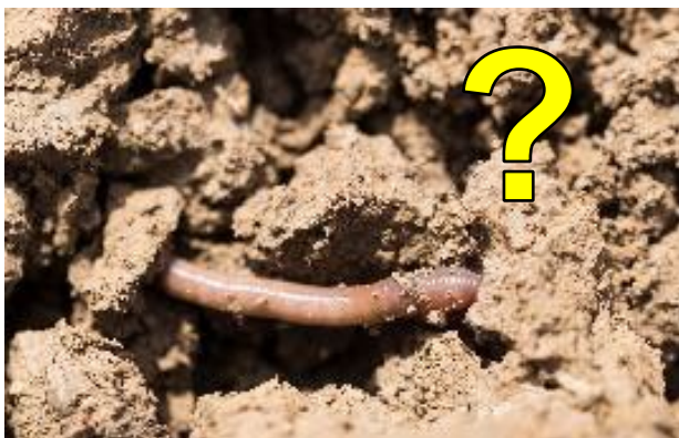
2 Wieviel Leben steckt in einem Quadratmeter Boden mit 30cm Tiefe?

Diese und viele andere Fragen werden Ihnen per Text, Bild, Audio und Film beim Bearbeiten der Module des E-Learning-Portals beantwortet. Mittels eines Selbsttests können Sie Ihren Lernerfolg am Ende jeder Lerneinheit überprüfen.