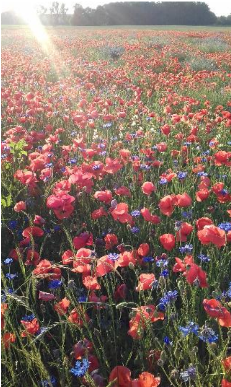
3 Blühstreifen sind wichtig für Insekten und andere Tierarten. Sie finden dort Schutz und Nahrung.

Die Module Ackerwildkräuter, Artenreiches Grünland, Begleitstrukturen, Biodiversität-warum Vielfalt, Blühstreifen, Boden-gesundheit, Die Honigbiene in der Kulturlandschaft, Futterqualität, Gewässer-schutz, Konservierende Bodenbearbeitung, Niederwild, Nützlinge in der Kulturlandschaft, Regionalvermarktung, Smart Farming und Streuobst bilden Themen im Spannungsfeld von Ökologie und Ökonomie sowie von Natur und Kultur ab. Biodiversität - Warum Vielfalt? und Regionalvermarktung stehen im Zentrum, da von ihnen die Motivation ausgeht, die Vielfalt in der Agrarlandschaft zu stärken.