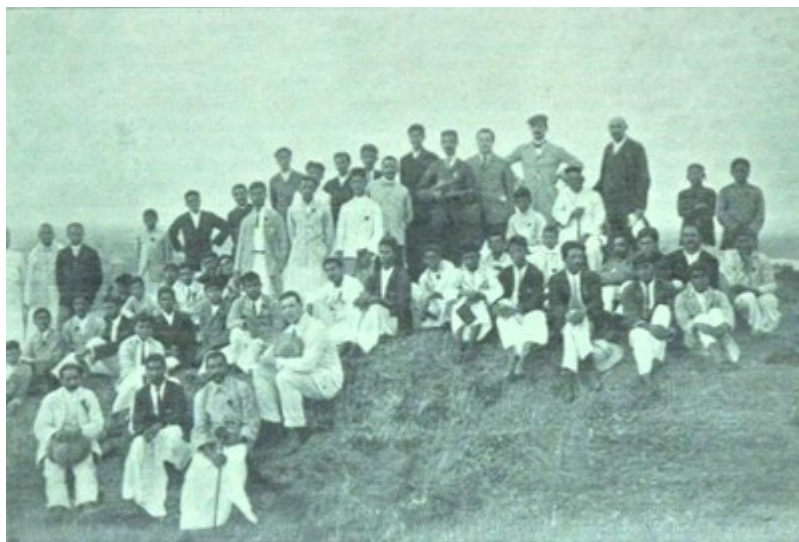
Participants of the Malabar Student Conference, May 1911. Der evangelische Heidenbote 1911, 80.

Humboldt-Universität zu Berlin Abteilung Kommunikation, Marketing und Veranstaltungsmanagement Referat Medien und Kommunikation