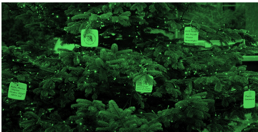
Der Spendenbaum wird mit jedem neu eingeworbenen Stipendium mit einer Dankestafel an die Förder*innen geschmückt.

Helfen Sie mit Ihrer Spende, 30 Studierende der HU zu unterstützen