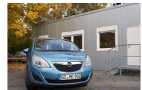
Das Smart Home auf dem Campus des KIT

MeRegioMobil (Halle 2, Stand D30). Auf dem Gemeinschaftsstand E-Energy zur Integration von modernen Informations- und Kommunikationstechnologien in die Stromversorgung präsentiert das KIT das Projekt MeRegioMobil, das darauf zielt, die Infrastruktur für eine große Zahl von Elektrofahrzeugnutzern zu konzipieren, aufzubauen und zu erproben. Dabei dient ein Smart Home Labor als Prototyp für den energieeffizienten Haushalt der Zukunft, der Elektroautos als Stromspeicher und -verbraucher einbindet.