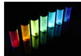
Optoelektronische Materialien

Elektronik aus der Druckmaschine. Gedruckte Elektronik ist ein Beispiel dafür, wie die Nanotechnologie vorhandene Produkte modifiziert und künftige Märkte eröffnet. Sie beruht auf der Herstellung elektronischer Bauteile mithilfe von Standarddruckverfahren wie Tintenstrahldruck, Siebdruck, Offsetdruck oder Tiefdruck. Wissenschaftler des KIT befassen sich mit der Synthese neuer druckbarer organischer und anorganischer Materialien, mit deren elektronischer Funktionalität und der Formulierung und Herstellung von Drucktinten. Weitere Schwerpunkte sind die Fertigung von organischen Solarzellen und Leuchtdioden sowie industrielle Beschichtungs- und Trocknungsprozesse, um die Erkenntnisse aus dem Labor auf die Massenproduktion zu übertragen. Am Stand sind organische