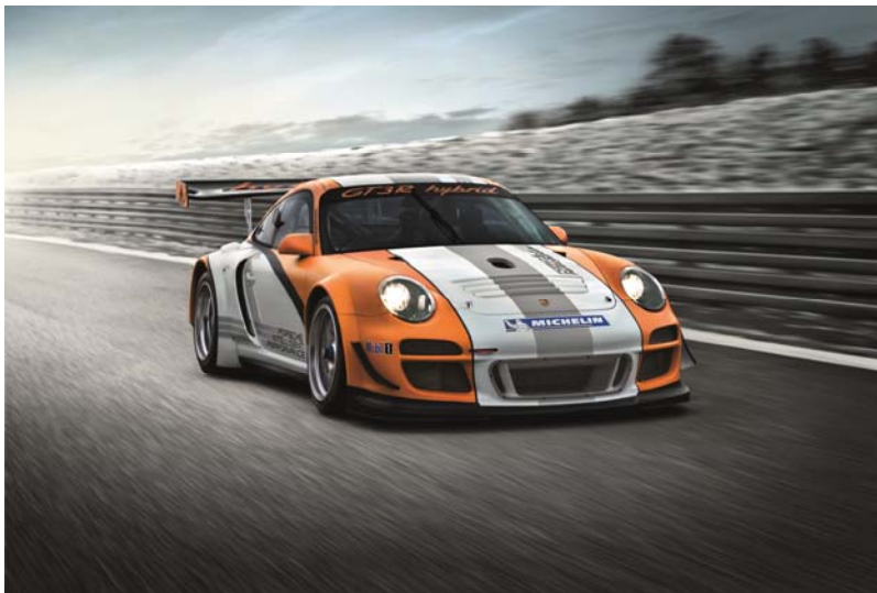
Reinrassiges Rennfahrzeug mit zwei Antriebseinheiten: der Porsche GT3 R Hybrid.

Rennporsche als Labor – Batterieforschung – Elektronik zum Drucken – KIC InnoEnergy