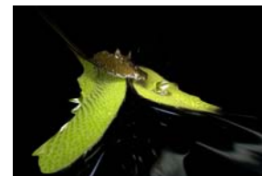
Erstaunliche Oberflächeneffekte führt das Netzwerk NanoMat vor.

NanoMat (Halle 2, Stand D30). Das Netzwerk für Materialien der Nanotechnologie NanoMat mit Geschäftsstelle am KIT besteht aus renommierten Unternehmen und Forschungseinrichtungen. Es gehört seit 2000 zu den Kompetenznetzen in Deutschland und ist Sprachrohr für die Arbeitsgemeinschaft der Nanozentren (AGeNT). Auf der Hannover Messe zeigt NanoMat Exponate zur Oberflächenvergütung und ein Live-Experiment zum neuen Salvinia-Effekt zwischen Lotus und Gecko.