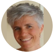
14:15 Juliana Kaulfürstowa Wjelestronska rěčna krajina Slěpe-Schleife-Slepo. Slepjanski region a jeho rěče Vielfältige Sprachlandschaft Slěpe-Schleife-Slepo. Die Schleifer Region und ihre Sprachen

Rěčnu krajinu móžeš słyšeć: Tu rěča ludźo jednu abo wjacore rěče, zwjetša přidatnje k swojemu dialektaj. Rěčnu krajinu pak móžeš tež widžeć: Rěč jewi so na taflach, scěnach, kamjenjach, plakatach atd. Kotre rěče wustupuja w Slepjanskim regionje? Hdže a w kotrej formje zetkawamy so tam ze serbšćinu? A z kotrej serbšćinu docyła – z hornoserbšćinu abo ze slepjanšćinu?