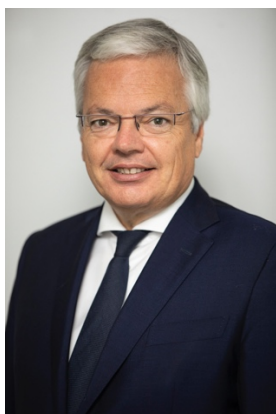
Didier Reynders

Humboldt-Universität zu Berlin Abteilung Kommunikation, Marketing und Veranstaltungsmanagement Referat Medien und Kommunikation