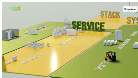
Abb. 53 Intro-Film zur Referenzfabrik.H2 www.referenzfabrik.de