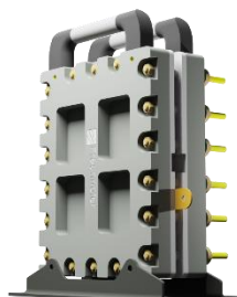
Abb. 3 Referenzstack eines Elektrolyseurs