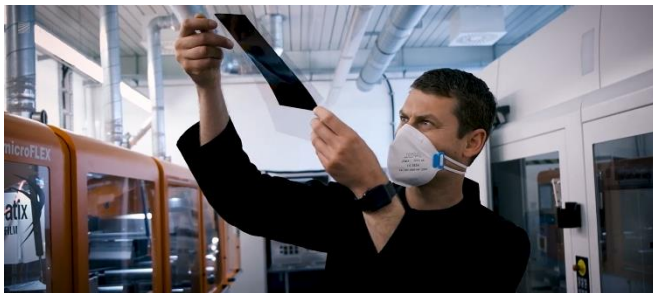
Abb. 2 CCM/MEA, hergestellt im Inkjet-Druckverfahren