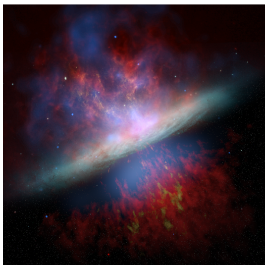
Kombiniertes Bild der Galaxie M81.

Oberer Teil: Beobachtung mit Hubble-Weltraumteleskop (cyan), Infrarotteleskop Spitzer (rot) und den Röntgensatelliten Chandra (blau). Unterer Teil: Visualisierung des von kosmischer Strahlung getriebenen galaktischen Windes in einer von Timon Thomas simulierten Galaxie.