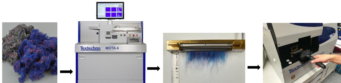
Abb.1 Aufbereitung der recycelten Fasern für die Klassifizierung (Faserlängenmessung)