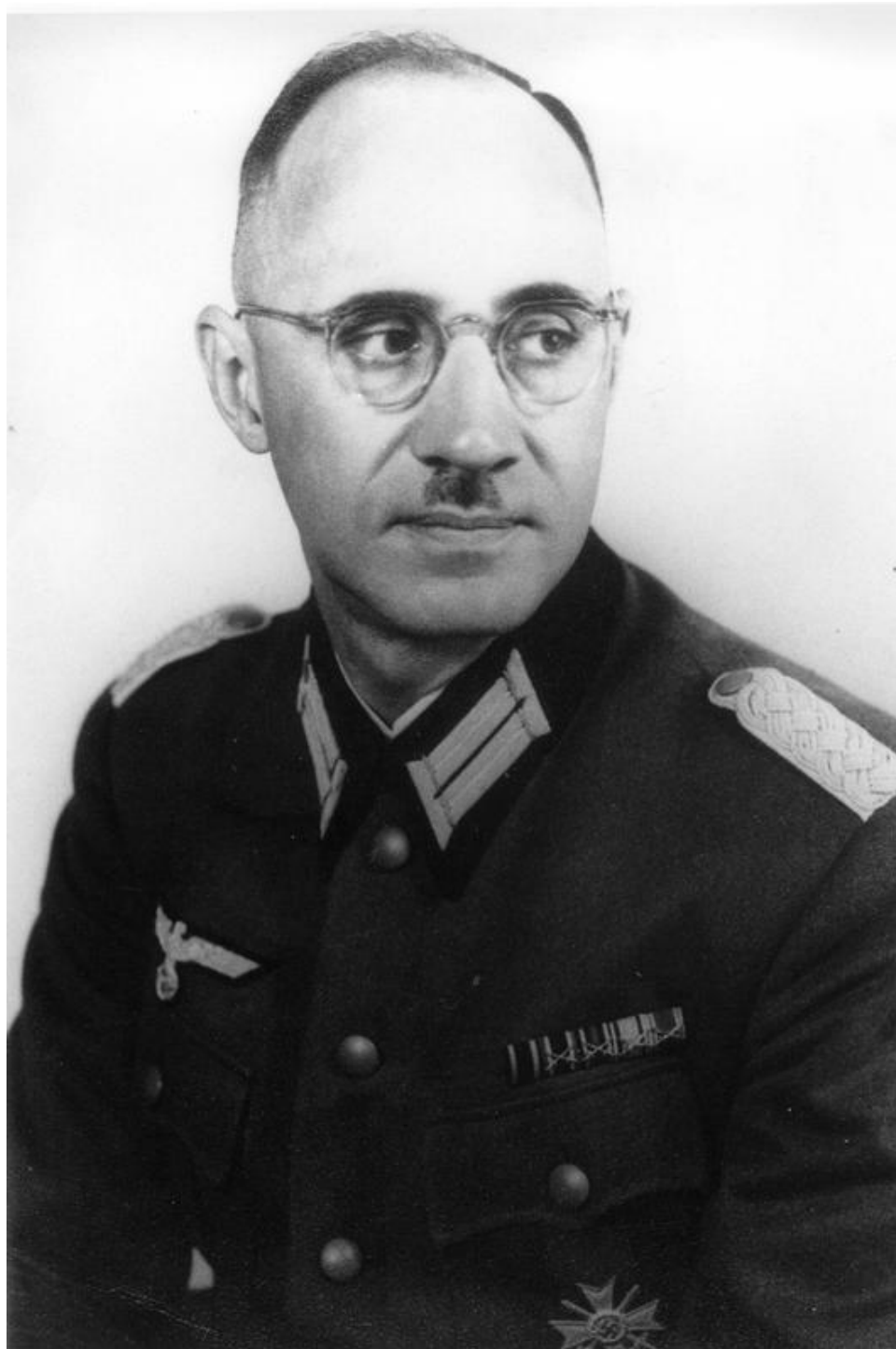
Karl Plagge TU Darmstadt