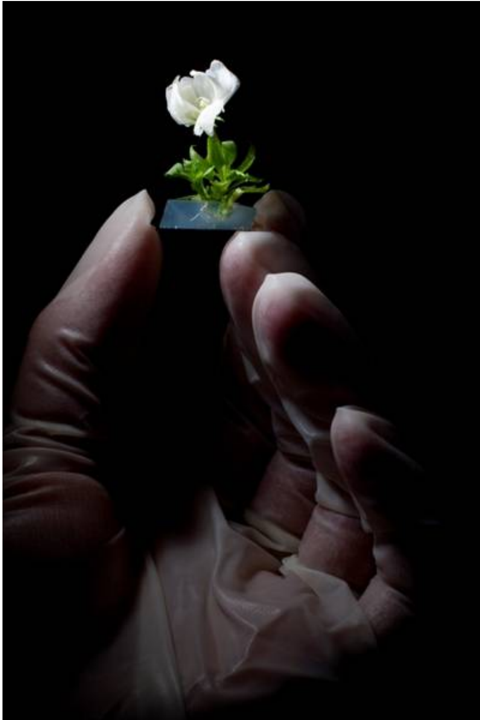
Sven Döring gewann den PUNKT 2009 in der Kategorie Foto/Einzelbild mit seinem Motiv "Apfelbaum in Blüte". Das Bild zeigt eine in Plastik gehüllte Hand, die mit ihren Fingerspitzen eine gentechnisch veränderte Apfelblüte festhält.