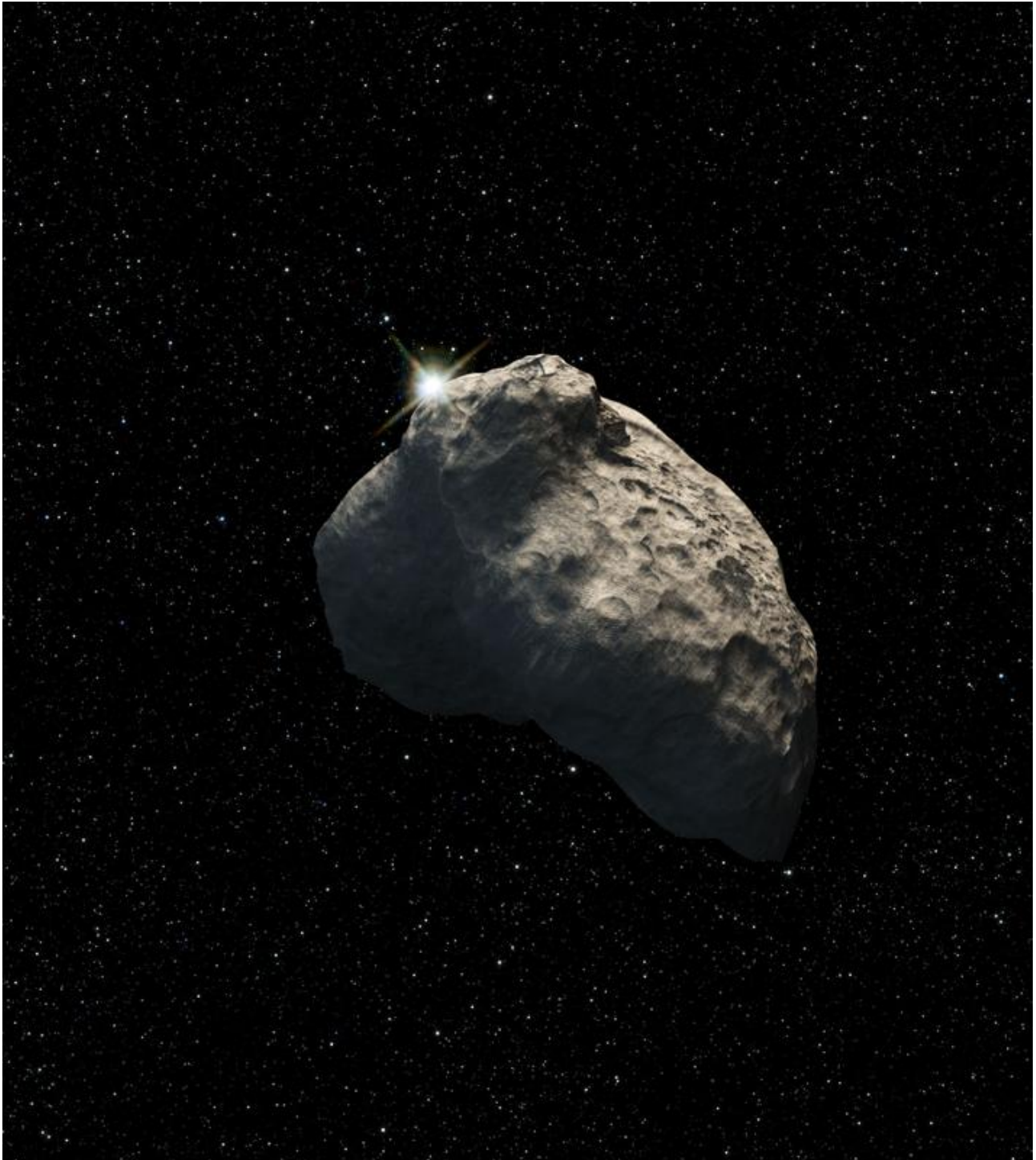
Künstliche Darstellung eines KBOs.