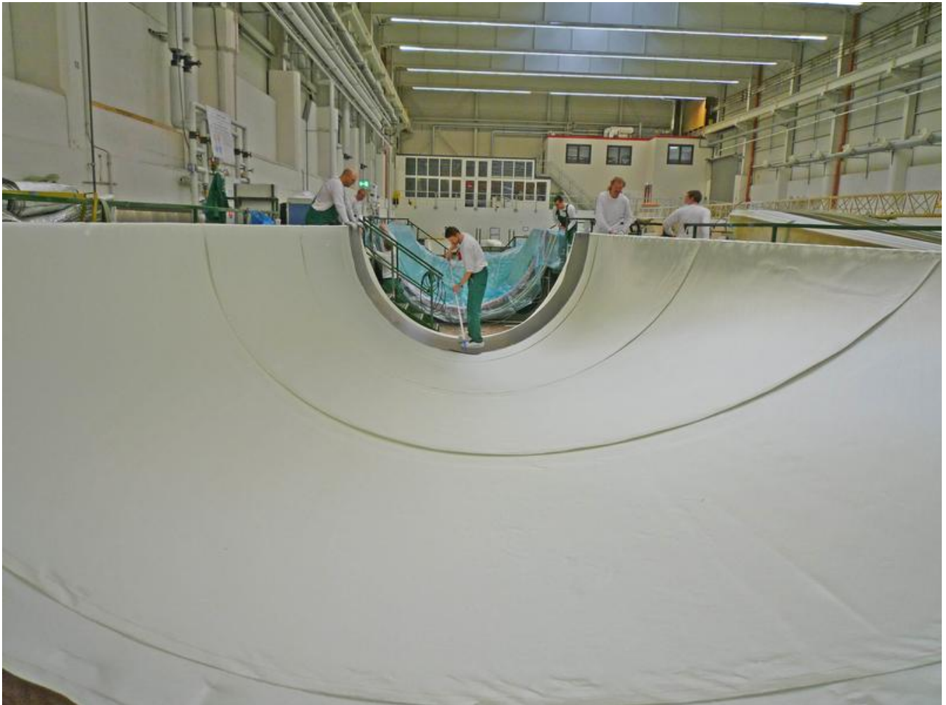
Produktion eines Rotorblattes

URL zur Pressemitteilung: http://www.aveva.com