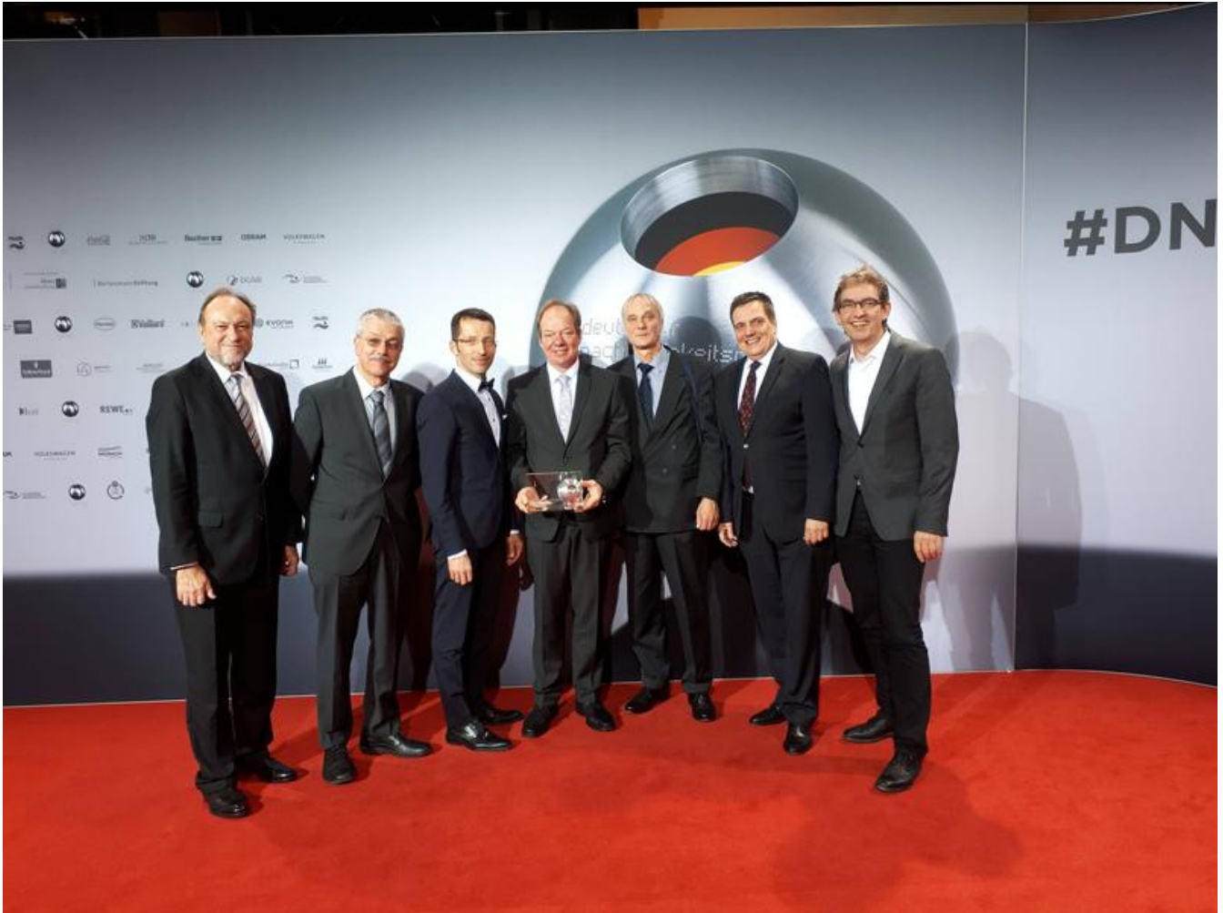
Deutscher Nachhaltigkeitspreis in der Kategorie Forschung: Die Gewinner bei der Preisverleihung in Düsseldorf.