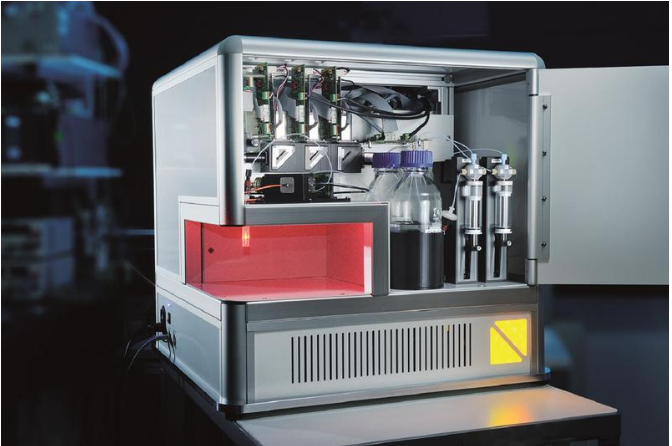
Mikrofluidische Ausleseeinheit für die spätere klinische Multiplex-Analytik.