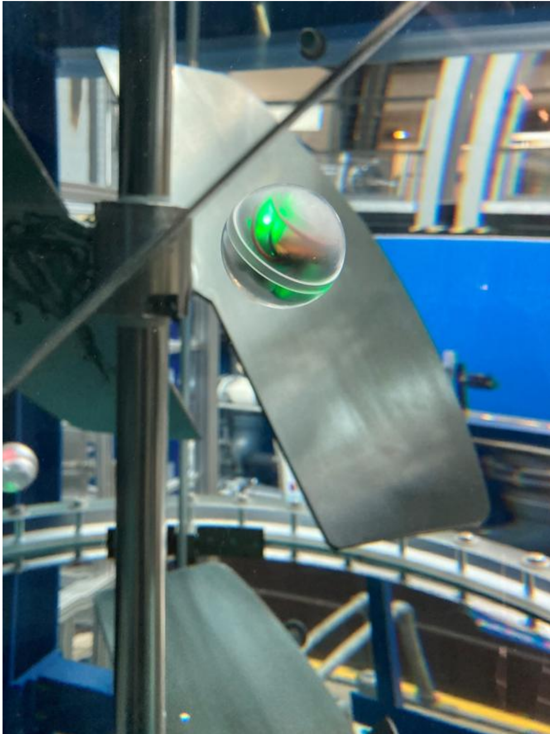
Der Sensor erfasst Daten und zeichnet Parameter von Lifelines im Bioreaktor auf, damit die Forschenden das Strömungsverhalten als Gesamtüberblick mitverfolgen können. Universität Stuttgart