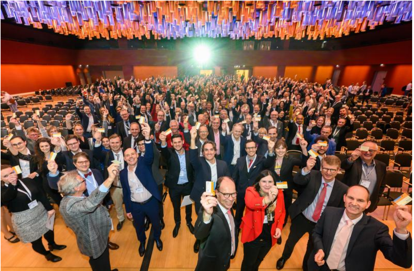
Herzmediziner:innen setzen Zeichen für Organspende