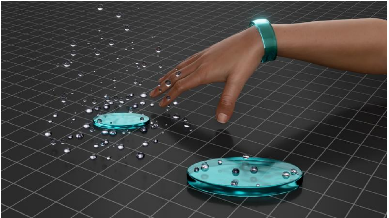
Intelligentes Gummimaterial, das sich der Umgebungsfeuchte anpasst. Das Armband demonstriert die Fähigkeit, sich an Bewegungen, zum Beispiel eines Handgelenks, anzupassen F. Sterl Universität Stuttgart, FSM-Labor