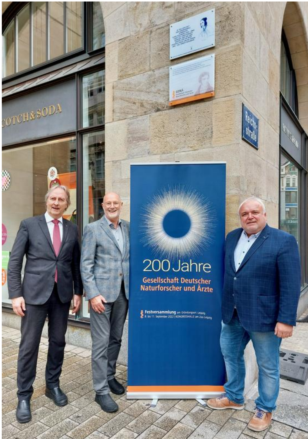
Enthüllung der Gedenktafel 200 Jahre GDNÄ am Gründungsort Grimmaische Straße in Leipzig H. Ulmer, Zoo Leipzig GDNÄ e.V.