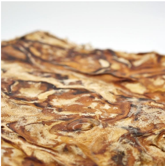
Abb. 4 Feste Strukturen reflektieren den Schall und sind somit für die Rahmenstrukturen einer Transmissionline-bestens geeignet

----- 14. März 2024 || Seite 4 | 4 -----