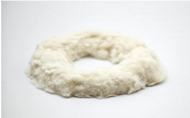
Abb. 3 Schaumartige Strukturen absorbieren (schlucken) den Schall und reduzieren unerwünschte Schwingungen

----- 14. März 2024 || Seite 4 | 4 -----