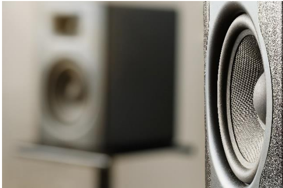
Abb. 1 Materialauswahl und Konstruktionsprinzip des Gehäuses haben großen Einfluss auf die Klangqualität eines Lautsprechers (Symbolbild)

www.iwu.fraunhofer.de