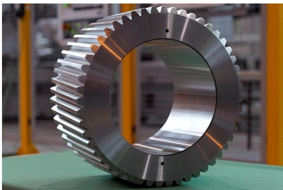
Abb. 2 Getriebebeschäden an Offshore-Windkraftanlagen sind teuer – der Einsatz besonders standfester Zahnräder wie in GEARFORM entwickelt zahlt sich aus

www.iwu.fraunhofer.de