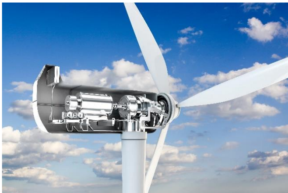
Abb. 1 Windkraftanlagen auf hoher See sind besonders effizient und leisten einen wichtigen Beitrag zur CO 2 -neutralen Stromproduktion (Symbolbild)

aufgrund eines Beschlusses des Deutschen Bundestages