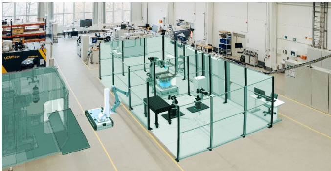
Abb. 2 Das in einer Matrix-Architektur aufgebaute Versuchsfeld am IWU-Standort Dresden bildet die Bühne: Flexible Fertigungszellen und digitale Zwillinge der Anlagen bilden auf dem Industrieworkshop am 26. September die Basis für einen Einblick in die SWAP-IT-Architektur.