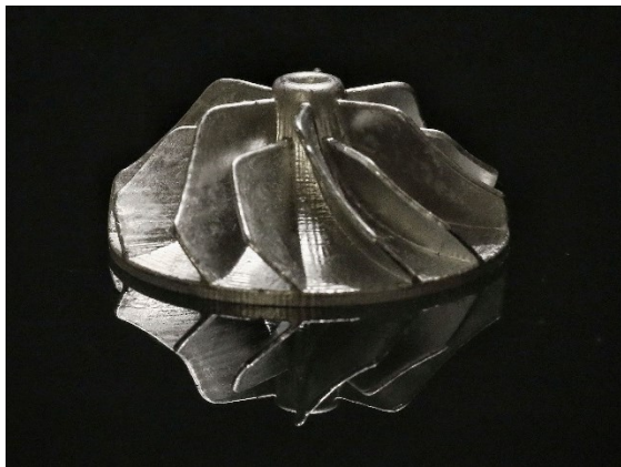
Sinterteil eines Impellers, hergestellt mit GelCasting

Weitere Informationen zu Additiver Fertigung am Fraunhofer IWS.