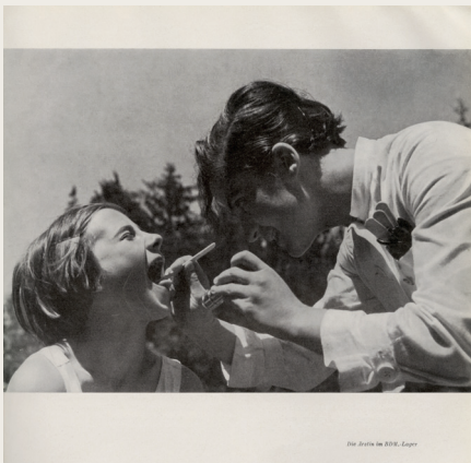
Foto-Abbildung „Die Ärztin im BDM-Lager“ aus: Amtlicher Katalog für die Ausstellung „Gesundes Leben Frohes Schaffen“, Berlin 1938, S. 69

The Nazi takeover of Germany in 1933 led to profound changes in all areas of society—including the healthcare system. By presenting individual case studies, the exhibition “Systemic Disorder: Doctors and Patients in Nazi Germany” demonstrates how life’s possibilities were radically transformed, especially for Jewish doctors and patients. It highlights the trajectory of individual careers, and how new tasks—and new areas of conflict—arose in the healthcare sector. How was the “forced” conformity of the medical profession’s organizations also by acquiescence? What happened to the Reich’s Jewish and “politically undesirable” physicians? What kind of medical care did civilian and military prisoners receive at concentration camps? And how did doctors and healthcare policymakers try to maintain health services for the German populace until the end of the war?