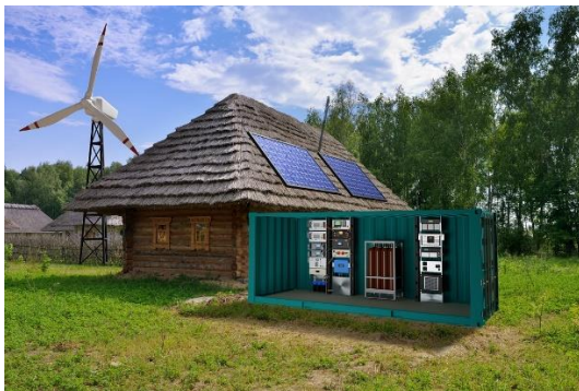
Abb. 1 Wasserstoff-basierte Microgrids sind perfekt für den Aufbau dezentraler Stromnetze mit erneuerbaren Energien geeignet

HyTrA und HygO werden gefördert durch das Bundesministerium für Umwelt, Naturschutz, nukleare Sicherheit und Verbraucherschutz