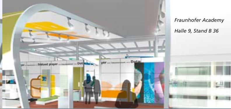
Fraunhofer Academy Halle 9, Stand B 36