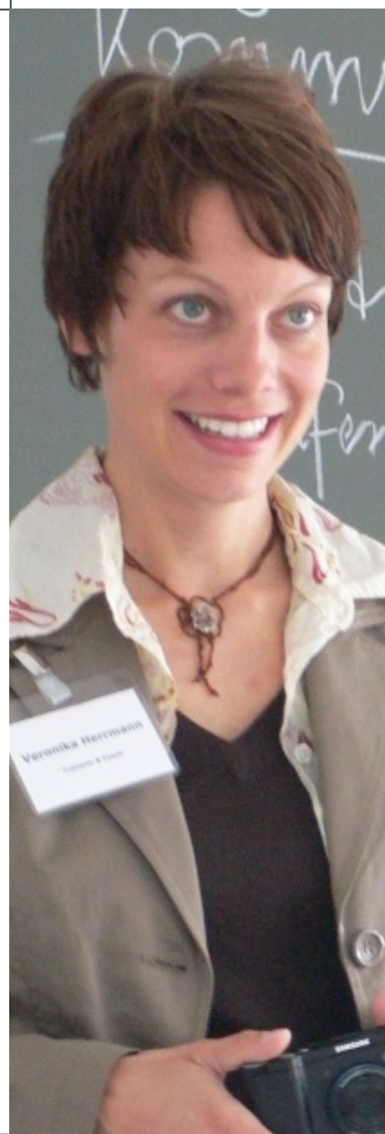
Gestaltung: Walter Jungbauer